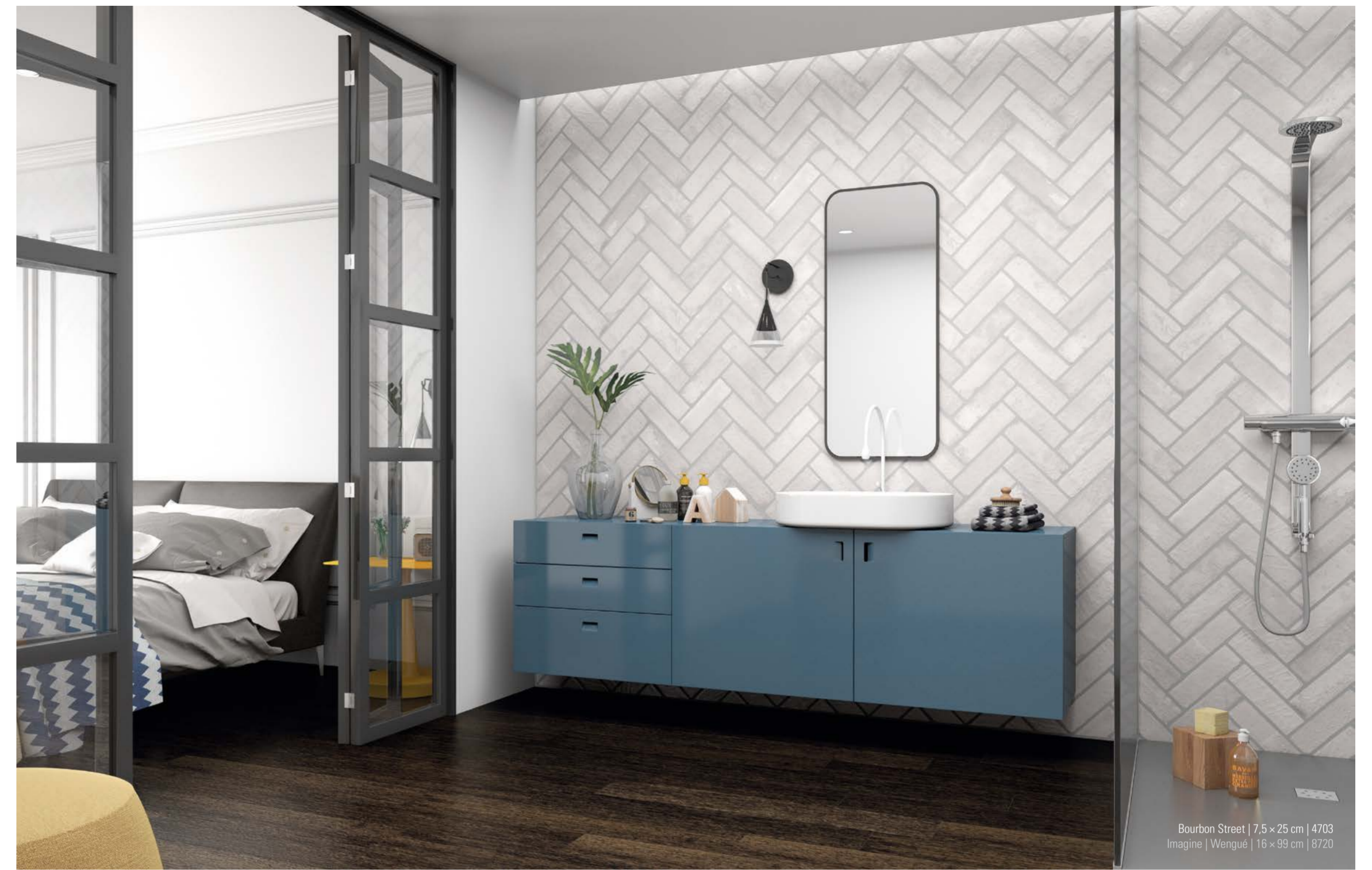
Bourbon Street | 7,5 x 25 cm | 4703 Imagine | Wengue | 16 x 99 cm | 8720