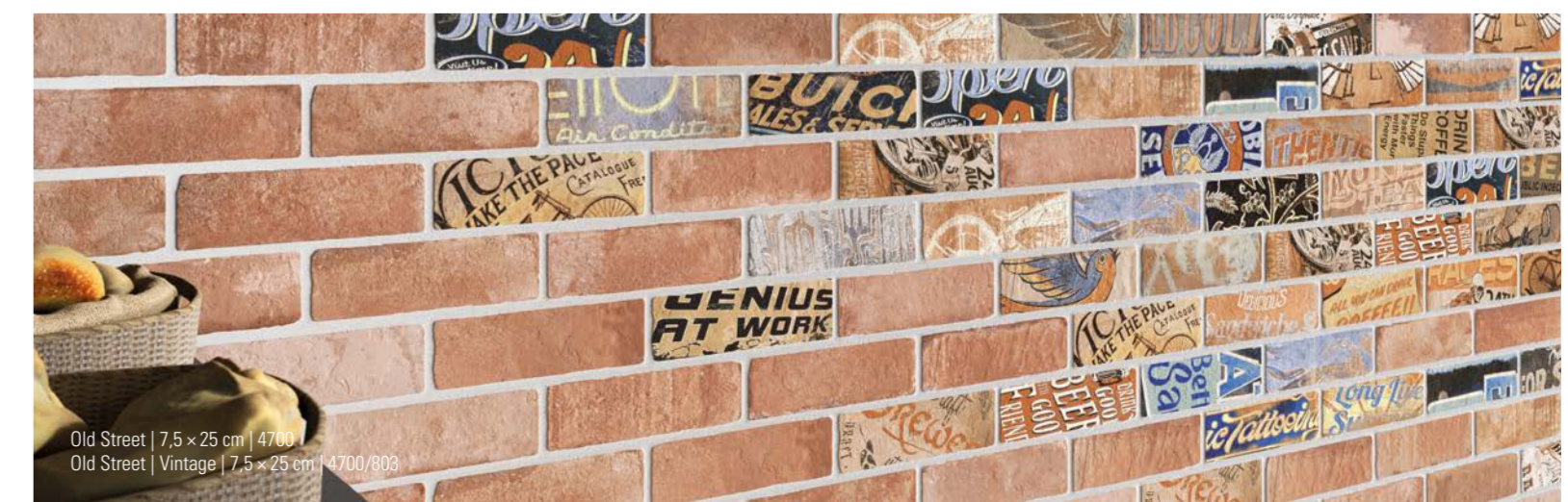
Old Street | 7,5 x 25 cm | 4700 Old Street | Vintage | 7,5 x 25 cm | 4700/803

12 VARIAÇÕES GRÁFICAS | 12 GRAPHIC VARIATIONS