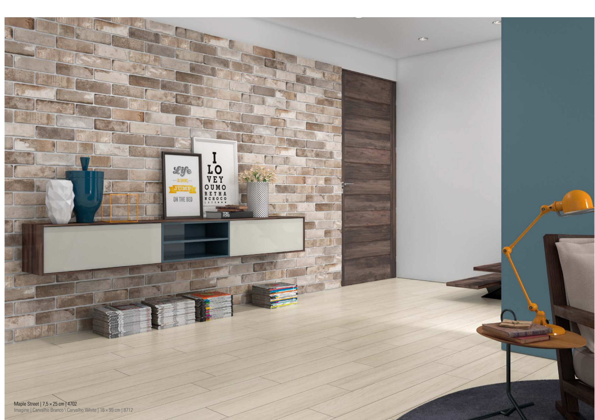
Maple Street | 7,5 x 25 cm | 4702 Imagine | Carvalho Branco | Carvalho White | 16 x 99 cm | 8712