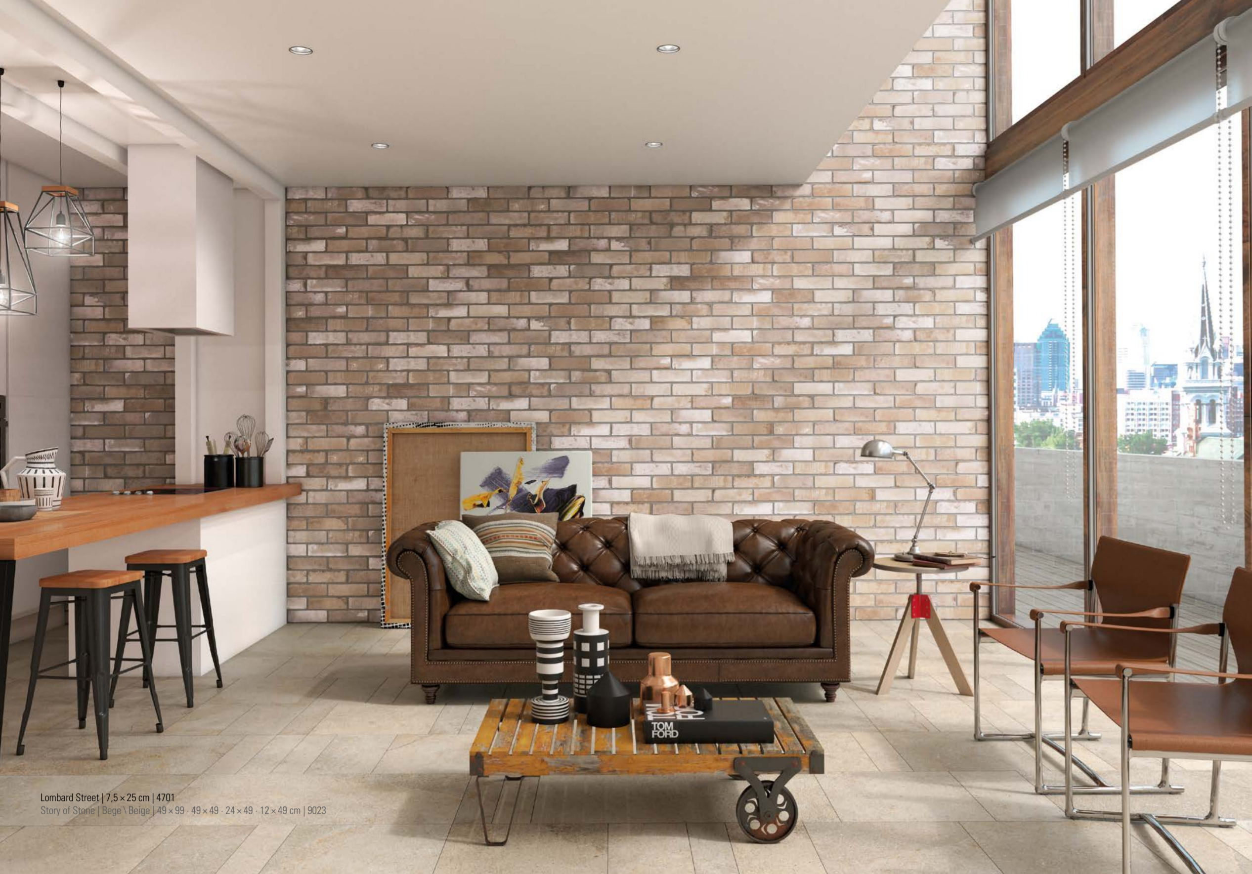
Lombard Street | 7,5 x 25 cm | 4701 Story of Stone | Bege | Beige | 49 x 99 - 49 x 49 - 24 x 49 - 12 x 49 cm | 9023