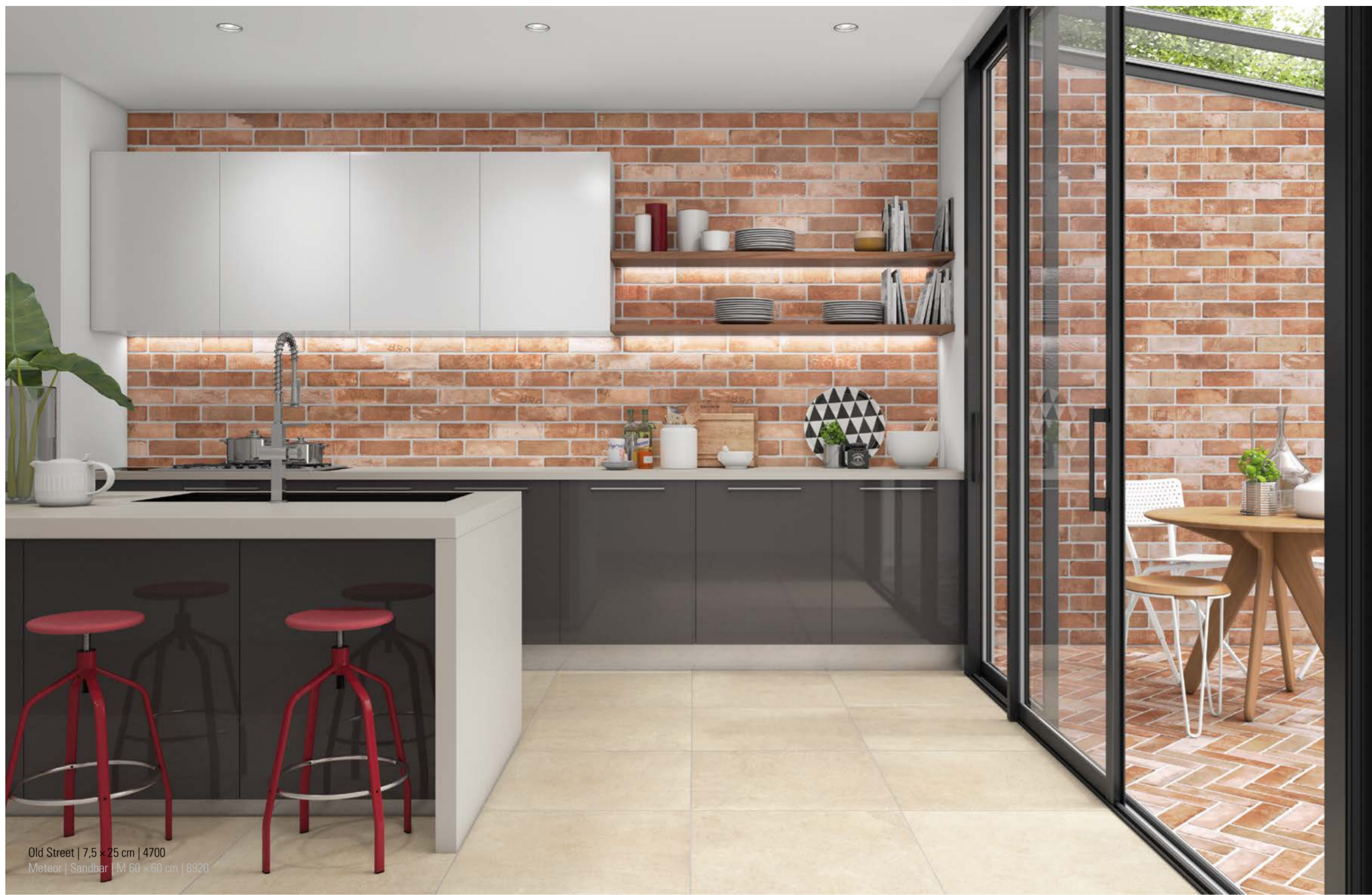
Old Street | 7,5 x 25 cm | 4700 Metacel | Sancher 100 x 60 cm | 8920