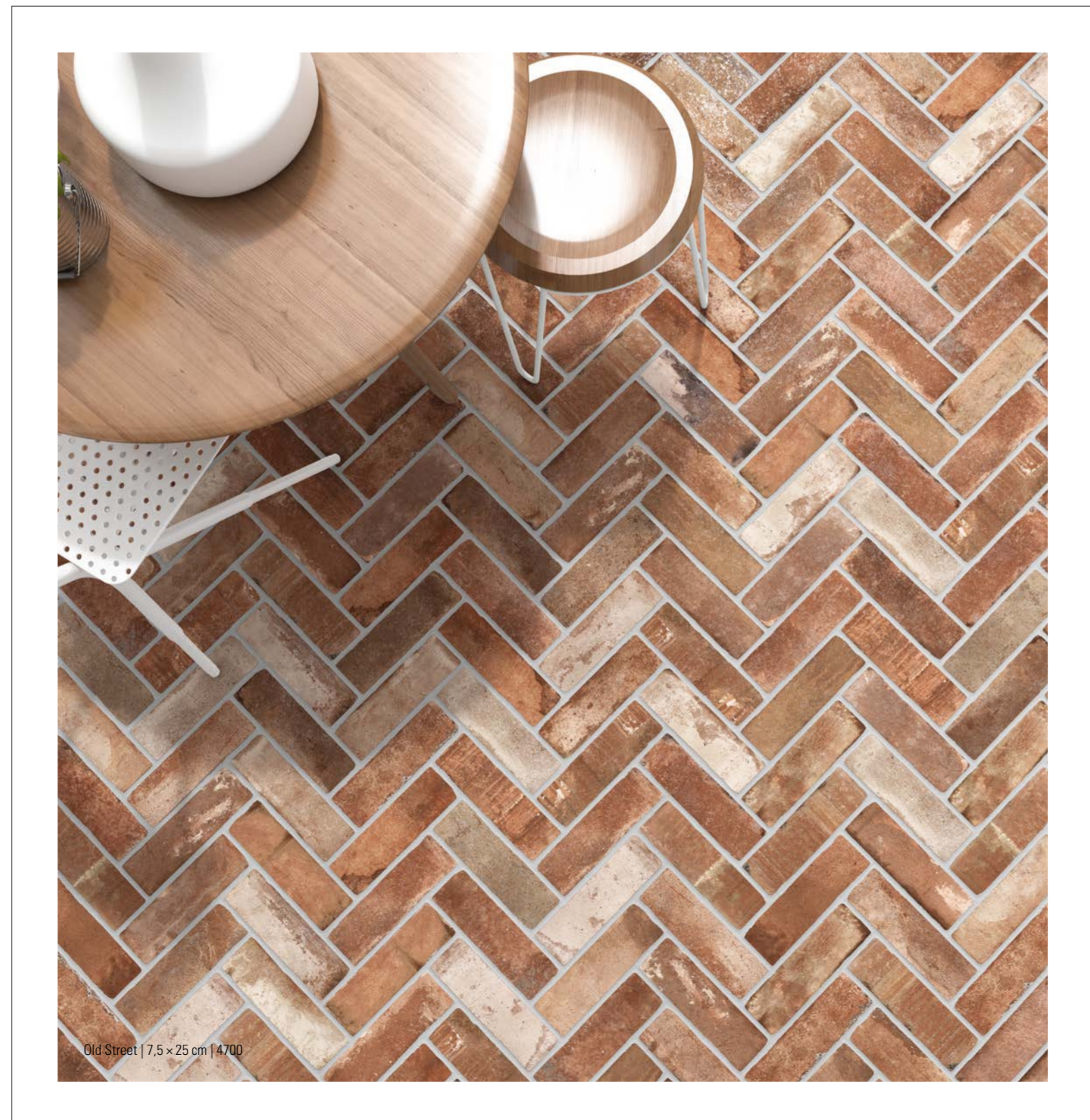
Old Street | 7,5 x 25 cm | 4700